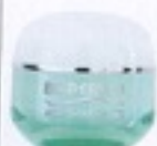
Aquanourve Spf 15, Biotherm Irrita in profondità lasciando la pelle morbida per ore. Contiene karité, vitamina E, Life Plankton. 44,90 €.